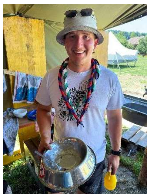
Wörk ist stolz auf seinen Teller